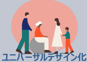
ユニバーサルデザイン化