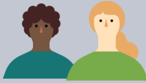
インバウンド向け対応